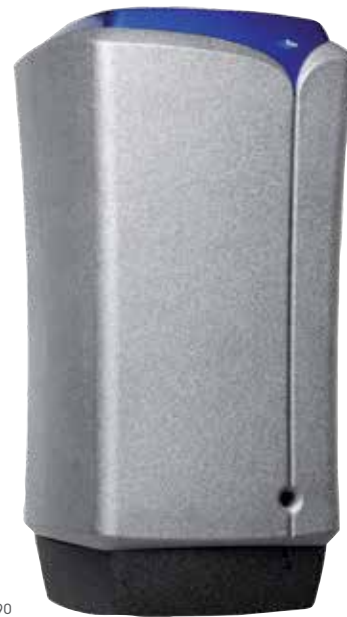
Boost Boiler LB90

Voor een goede werking is het belangrijk dat de Boost boiler in de directe omgeving van de van de warm water bereider wordt geplaatst (maximaal 3 meter afstand tussen bereider en Boost boiler). De Boost boiler is voorzien van 1,5 meter aansluitsnoer dat op een 230V AC randaarde wandcontactdoos moet worden aangesloten.